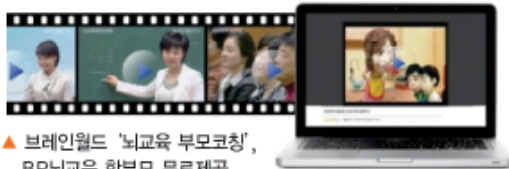
▶ 브레인월드 '뇌교육 부모코칭', BR뇌교육 학부모 무료제공