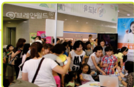
▶ (주)BR뇌교육, '브레인 어드벤처' 참가