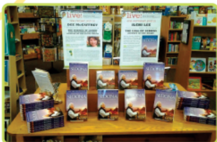
▶ <세도나 스토리> 미국 대형출판사 '스크리브너서' 재출간