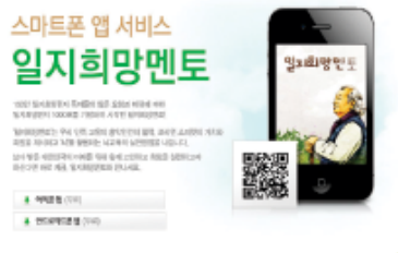
▶ 이승현 협회장, 스마트폰 멘토링서비스 '일지희망멘토' 출시